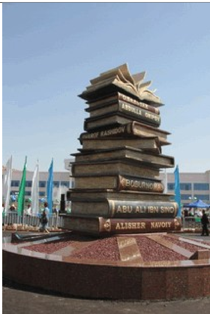
19 февраль 2008 йил - Арманистонда “Китоб совға қилиш куни” байрами